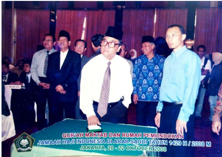
Gambar 50. Qur'ah Maktab dan Rumah Pemandokan Jama'ah Haji Indonesia di Arab Saudi tahun 2008

Keempat , terjadi pada bulan Juli tahun 2011. Kali ini, Kalimantan Selatan menjadi tuan rumah Seleksi Tilawatil Qur'an Tingkat Nasional (STQ Nasional). Kegiatan ini rencananya akan dipusatkan di Banjarmasin dan Banjarbaru. " Hanya saja, sangat disayangkan. Waktu pelaksanaan acara STQ itu saya sudah tidak lagi menjabat sebagai Ka. Kanwil Kementerian Agama Provinsi Kalimantan Selatan, " ungkap beliau.