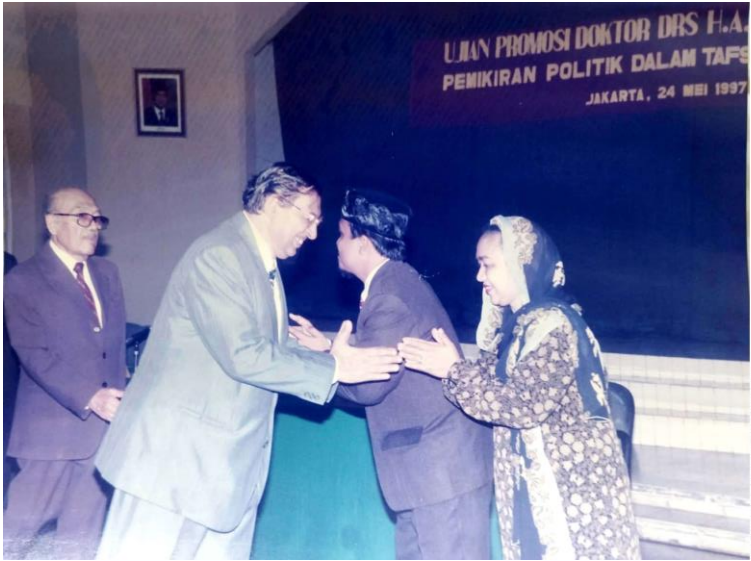
Gambar 27. Ucapan selamat Dari Rektor Prof. Dr. H. Quraish Shihab, MA dan Direktur Pascasarjana Prof. H. Harun Nasution, MA pasca ujian disertasi di IAIN Syarif Hidayatullah Jakarta 1997