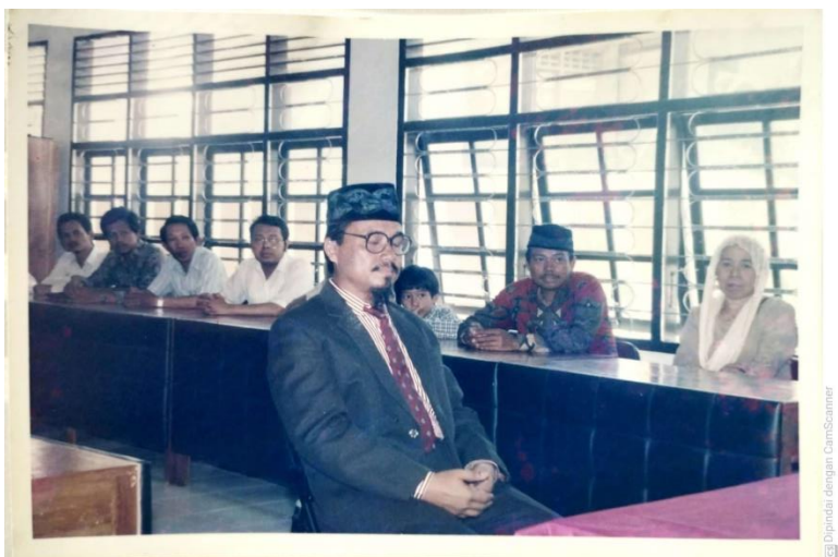
Gambar 25. Ketika berlangsung ujian tesis Pascasarjana IAIN Alauddin Makassar