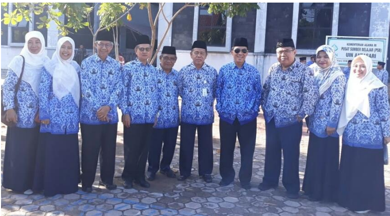
Gambar 37. Bersama dosen dan ASN UIN Antasari Banjarmasin pada upacara HAB Kemenag RI

Jabatan fungsional dosen yang murah senyum ini tak berhenti di situ. Tepat pada 1 Oktober 1998 beliau memperoleh jabatan baru sebagai Lektor Kepala. Disusul pada 1 April 2002 dan 1 Oktober 2007 masing-masing menjadi Pembina Utama Madya dan Pembina Utama. Puncak jabatan fungsional akhirnya beliau raih pada 1 Mei 2001, yakni sebagai Guru Besar dalam Ilmu Al-Balaghah. Gelar Guru Besar ini diraihnya saat masih menjadi PNS golongan IV/c sebagai Pembina Utama Muda. Prestasi ini tentu saja sungguh membanggakan bagi beliau, keluarga, dan UIN Antasari Banjarmasin serta masyarakat Kalimantan Selatan.