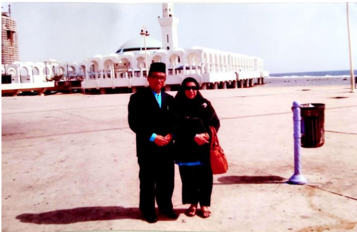
Gambar 58. Berfoto di depan mesjid terapung Jeddah tahun 2010

Beliau terkagum dengan suasana bandara King Abdul Aziz yang mewah, cantik, indah, gemerlap. “Sungguh, luar biasa!”. Bagaimana tidak? Bandara tersebut sangat sibuk. Di setiap lima menit ada saja pesawat yang mendarat dan ada juga yang berangkat ke destinasi tertentu. “Benar-benar bandara yang super sibuk!” Dari sini saja sudah nampak jelas perbedaan suasana dan kondisi di Banjarmasin dengan Saudi Arabia.