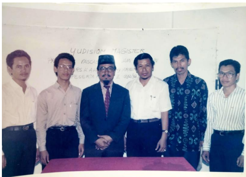
Gambar 26. Bersama teman-teman mahasiswa Pascasarjana IAIN Alauddin Makassar setelah ujian tesis