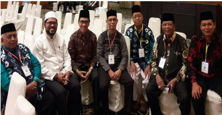
Gambar 42. Bersama peserta Konferensi Internasional ACIS di Banjarmasin.

Karirnya yang bagus dalam mengajar diimbangi dengan keaktifan beliau dalam mengikuti berbagai konferensi, seminar, dan pelatihan. Kegiatan-kegiatan tersebut terselenggara di tingkat lokal, regional, nasional, ataupun internasional. Tema-tema kegiatan yang beliau ikuti tidak hanya seputar Bahasa Arab, melainkan pula tasawuf, parenting , kurikulum, dan ushuludin. Partisipasi beliau sebagai peserta dalam kegiatan-kegiatan tersebut menunjukkan bahwa beliau sosok yang gemar menimba ilmu dan mengikuti perkembangan ilmu pengetahuan.