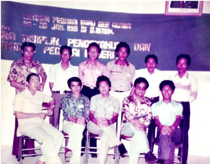
Gambar 36. Bersama teman-teman CPNS Dosen IAIN Antasari Banjarmasin

Semangat waja sampai kaputing yang ditempa dengan kedisiplinan menjadikan beliau gigih dalam meniti karir. Bermula dari pertama kali diangkat sebagai Calon Pegawai Negeri Sipil (CPNS) di IAIN Antasari Banjarmasin pada 1 Maret 1980. Kemudian pada 1 Juni 1981 beliau berhak menjadi PNS golongan III/a sebagai Penata Muda.