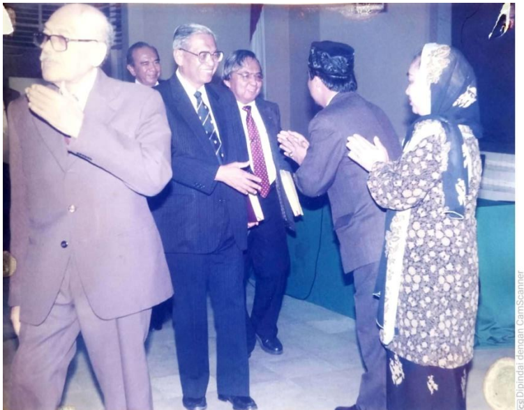
Gambar 28. Ucapan selamat dari penguji ujian disertasi di IAIN Syarif Hidayatullah Jakarta 1997