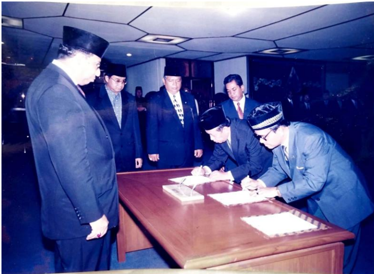
Gambar 45. Penandatanganan berita acara pelantikan Ketua STAIN Samarinda disaksikan Menteri Agama RI Prof. Dr. H. Said Agil Al-Munawwar, MA