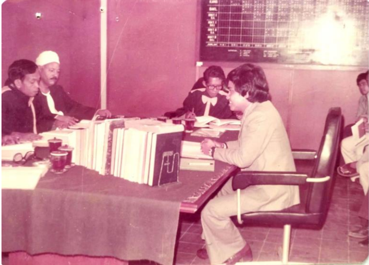
Gambar 19. Suasana ujian sidang munaqasyah skripsi Jurusan Bahasa dan Sastra Arab, Fakultas Adab, IAIN Sunan Kalijaga Yogyakarta tahun 1979