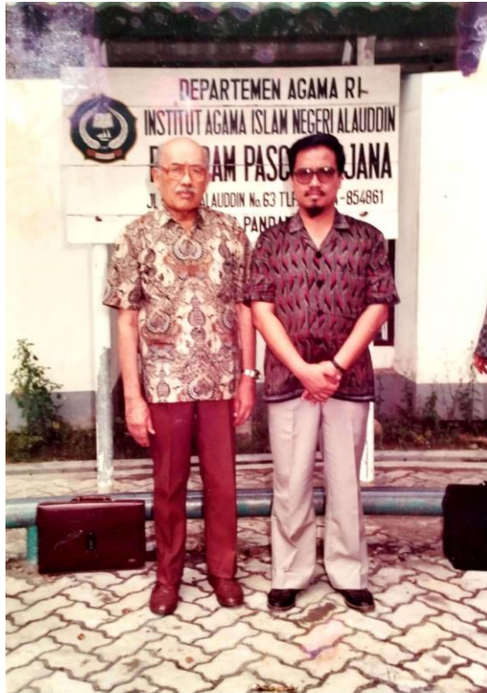
Gambar 22. Bersama Prof. H. Harun Nasution, MA Sewaktu Studi S2 di IAIN Alauddin Makassar Sulawesi Selatan 1993