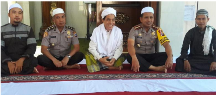
Gambar 46. Bersama bapak Kapolresta Banjarmasin, sewaktu peresmian mesjid Polresta Banjarmasin Ikhlasul Mukmin, sekaligus menjadi khatib Jum'at perdana di mesjid tersebut

Berbagai kegiatan pengabdian kepada masyarakat yang telah dilakukan profesor ini tidak terhitung jumlahnya. Beliau kerap menyampaikan khotbah dan ceramah agama di berbagai kegiatan keagamaan. Konten ceramahnya dapat disimak oleh berbagai kalangan di majelis taklim, televisi, radio, maupun berbagai acara hajatan yang diadakan oleh masyarakat. Bukan hanya itu, beliau juga sering menjadi pemateri dalam berbagai seminar dan orasi ilmiah. Profesor kelahiran Amuntai ini juga kerap memberikan pelatihan-pelatihan akademis, khususnya yang berkaitan dengan Bahasa Arab yang merupakan bidang keahliannya.