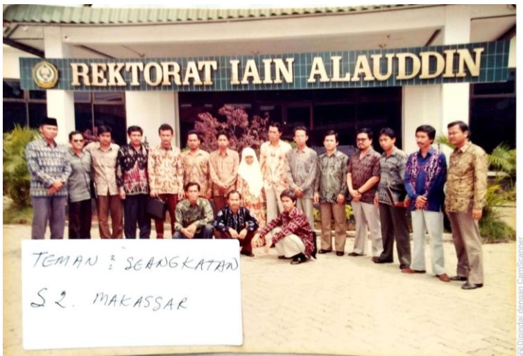
Gambar 24. Bersama kawan-kawan seangkatan S.2 di IAIN Alauddin Makasar