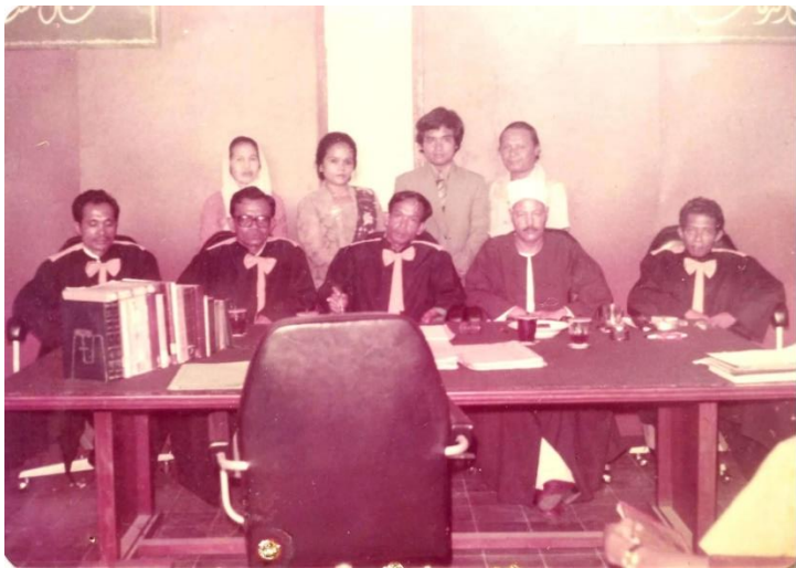
Gambar 20. Foto bersama keluarga dan tim penguji skripsi yaitu dosen dalam negeri dan dosen luar negeri