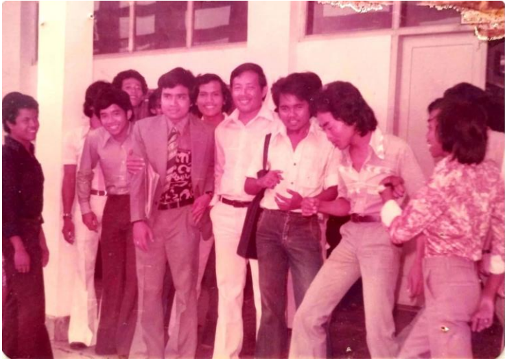
Gambar 21. Foto bersama kawan-kawan, Suasana setelah selesai ujian skripsi S.1