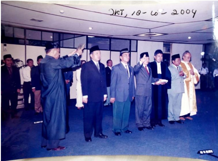
Gambar 44. Pengambilan sumpah jabatan pada pelantikan Ketua STAIN Samarinda 2004